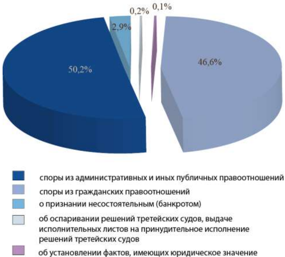
Поступление заявлений по категориям за 2012 год

К производству суда в 2012 году принято 15 233 заявления, что на 2 706 дел или 22 % больше, чем в 2011 году (12 527 заявлений).